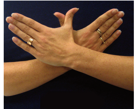
Figuur 3: het gebaar 'vinder'.

Dit artikel heeft een uitbreiding op praxisbulletin.nl . Daar zijn opgenomen: een kennismaking met gebaren (met vele afbeeldingen als voorbeeld) en het volledige handalfabet.