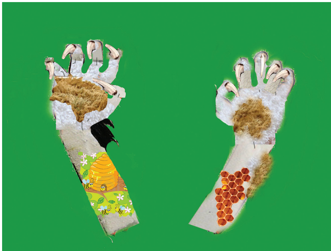
Figuur 2: werkstuk 'beer'.