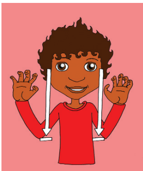
Figuur 1: het gebaar 'beer'.